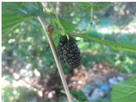
Gelso nero (Nardò)