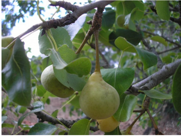
Caroppo (Torre S. Susanna)