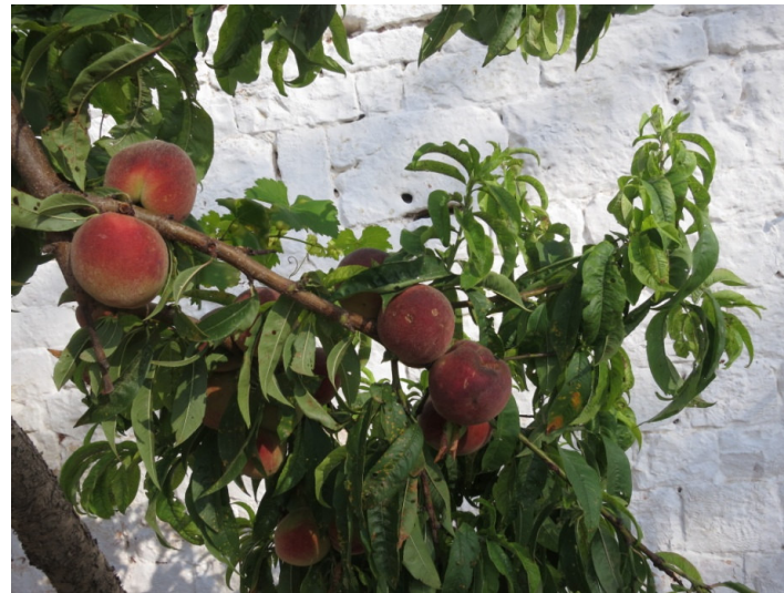
Rosso di Latiano