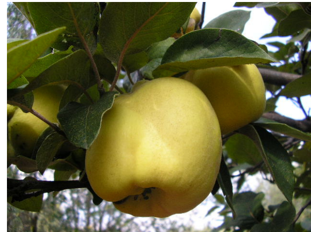
Cotogno Maliforme (Martina Franca)