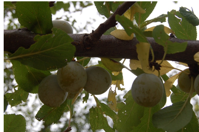
Cascaville (Orsara di Puglia)