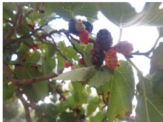
Gelso sanguigno nero (Borgagne)