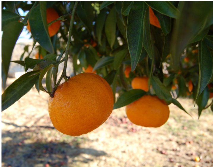
Mandarino profumato di Monopoli