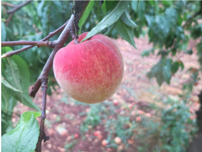
Pesca bianca di Putignano