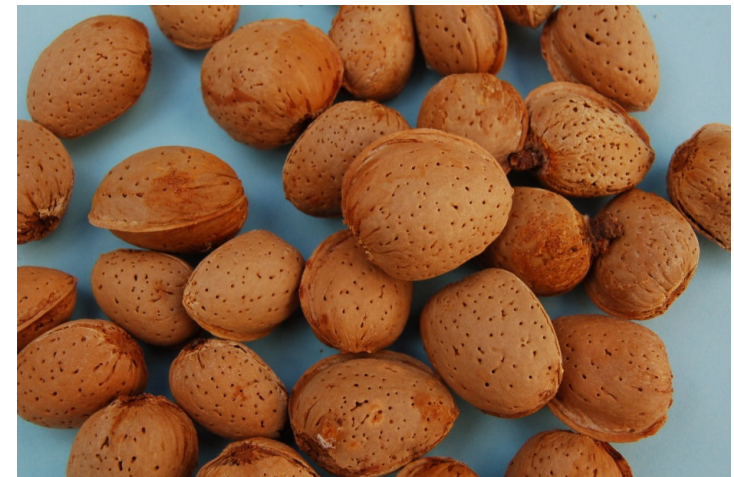
Chionna (Francavilla Fontana)