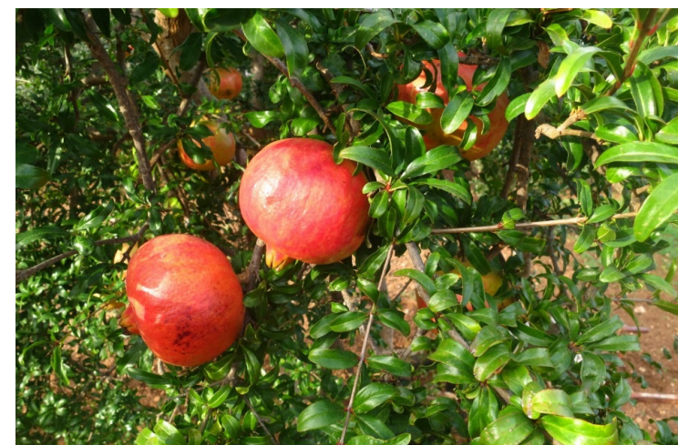
Dente di cavallo (Alberobello)