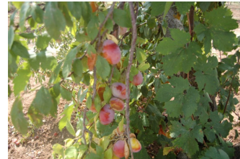
Santa Rosa di Acquaviva (Acquaviva delle Fonti)