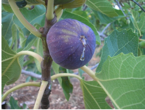
Folla (Martina Franca)