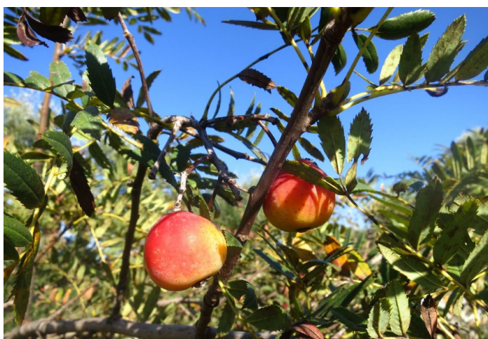
Sorbo a frutto grosso (Castellana Grotte)