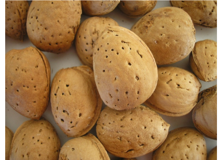
Mingunna (Ceglie Messapica)