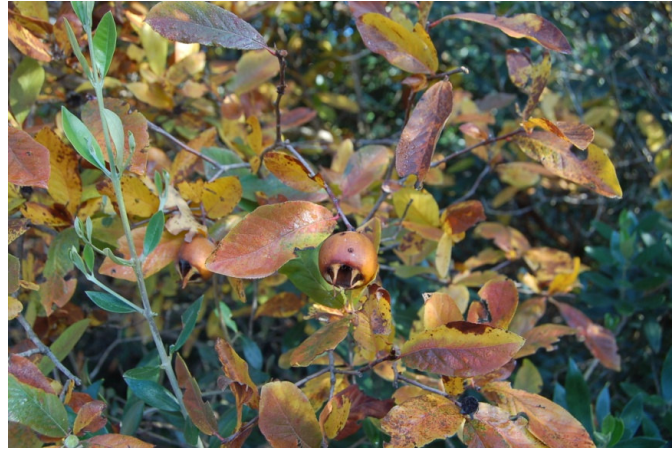
Nespolo a frutto piccolo (Cassano delle Murge)