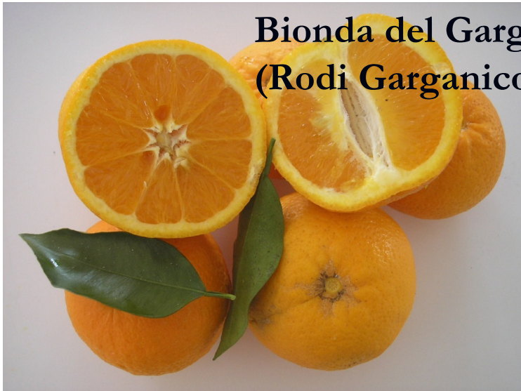
Bionda del Gargano (Rodi Garganico)