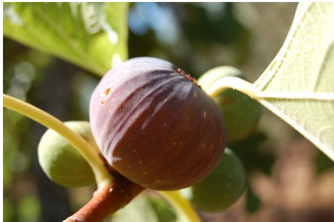
Abbondanza (San Michele Salentino)