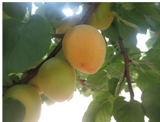
Buontempo (Francavilla Fontana)