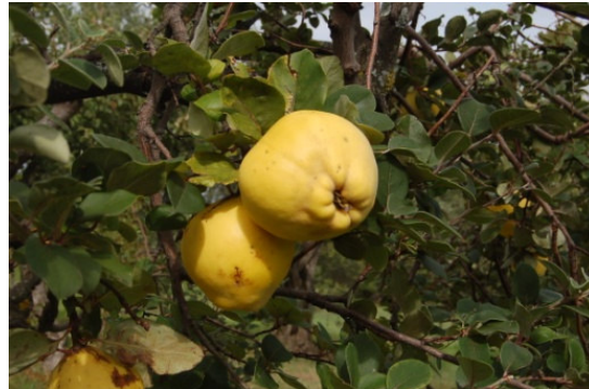
Cotogno Mollesca (Villa Castelli)