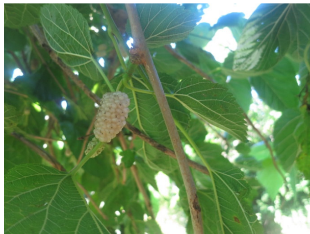
Gelso bianco (Gioia del Colle)