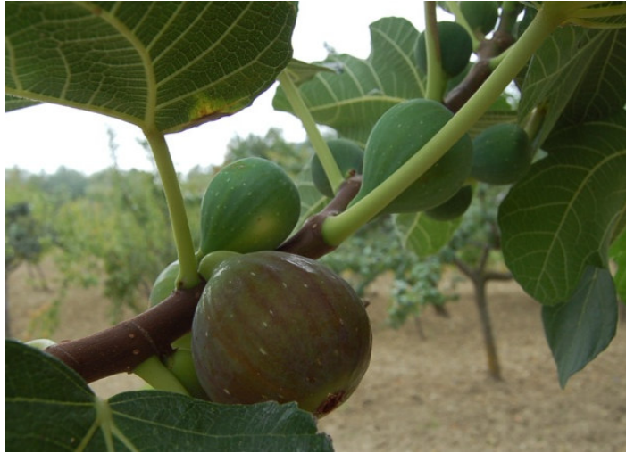
Muso rosso (Biccari)