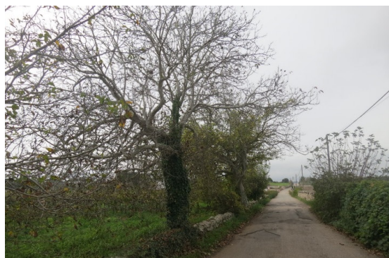
Noci in Valle d'Itria