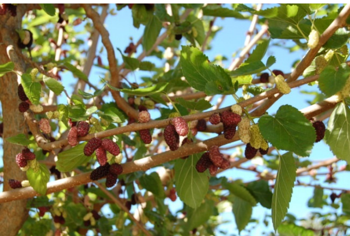
Gelso di Caterina (Francavilla Fontana)