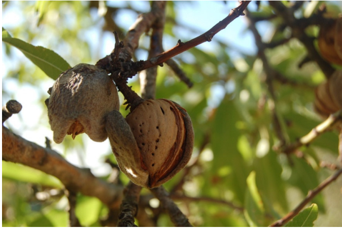
Riviezzo (Ceglie Messapica)