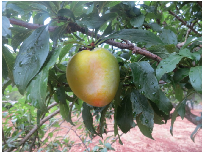
Cuore di donna (Ceglie Messapica)