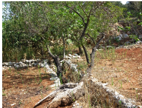
Carluccio (San Vito dei Normanni)