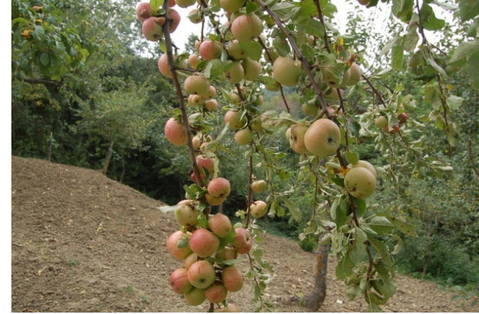
Agostinella (Orsara di Puglia)