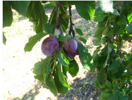
Prugna di Ascoli (Ascoli Satriano)