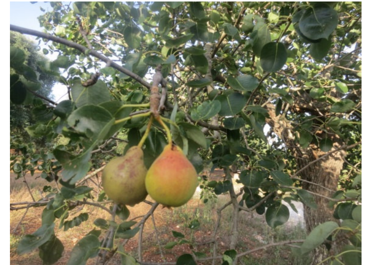
San Paolo (Locorotondo)