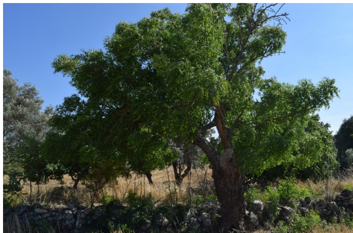
Giuggiolo monumentale di Soletto