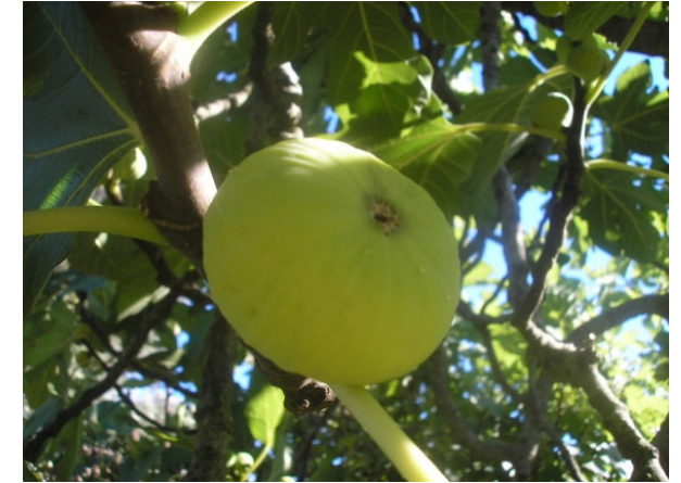
Lattarola (Francavilla Fontana)