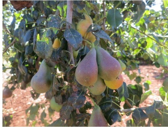
Coscia di donna (Putignano)