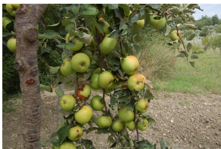
Cucuzzara (Motta Montecorvino)