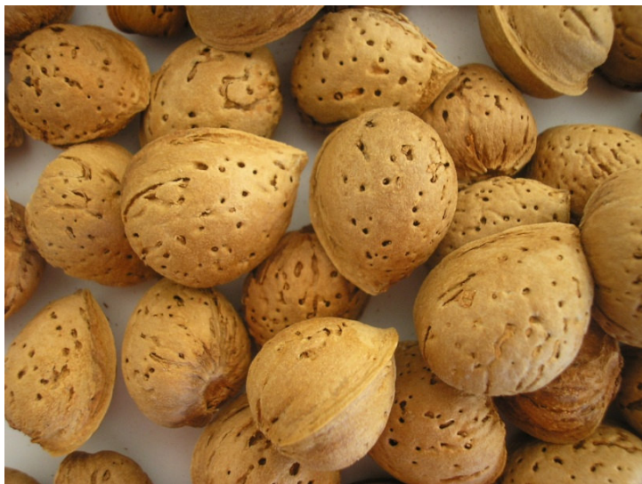
Spappacarnale (Ceglie Messapica)