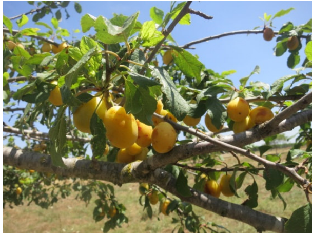
Passule di Spagna (Mesagne)