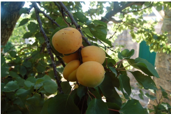
Mandorla dolce (Bisceglie)