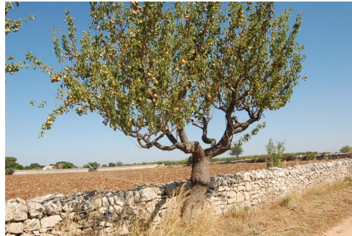
Terlizzese (Gioia del Colle)