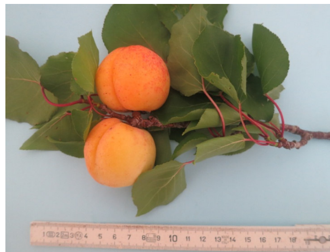
Albicocco di Galatone (Galatone)