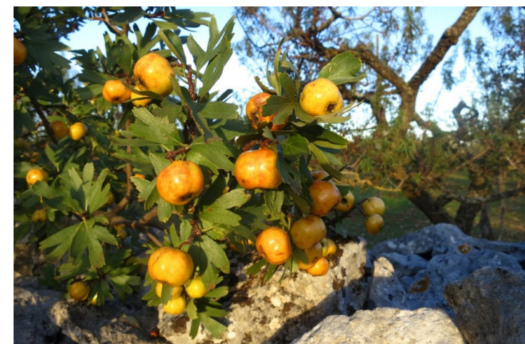
Azzeruolo giallo (Putignano)