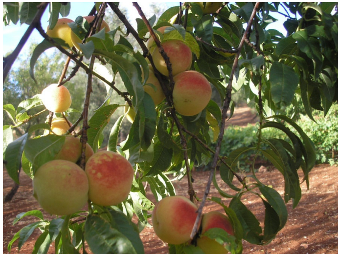
Persichine (Ceglie Messapica)