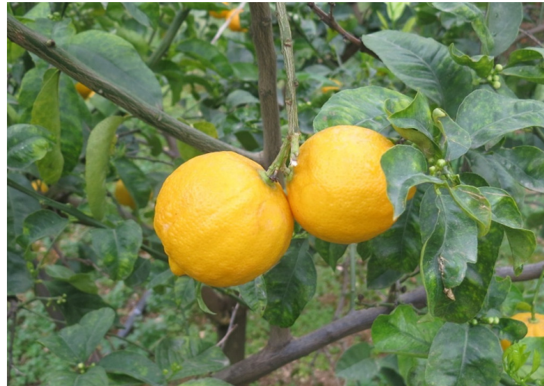
Limetta dolce (Fasano)