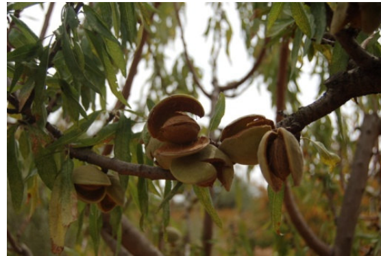
Sammichelana (San Michele Salentino)