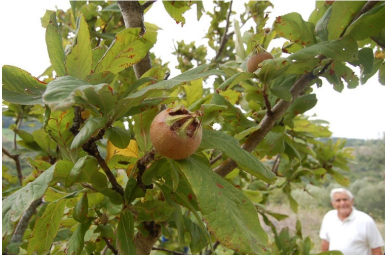
Nespolo a frutto tondo (Orsara di Puglia)