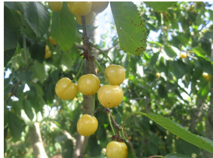
Bianca al limone (Putignano)