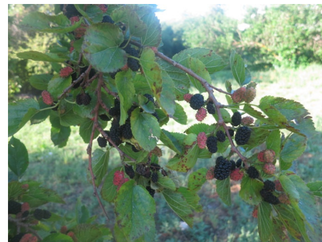
Gelso nero piccolo (Monteroni)