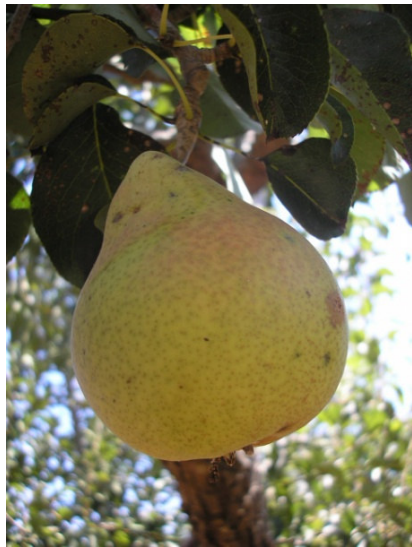
Casale (San Michele Salentino)