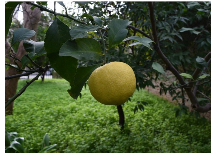
Limone Femminello comune (Bari)