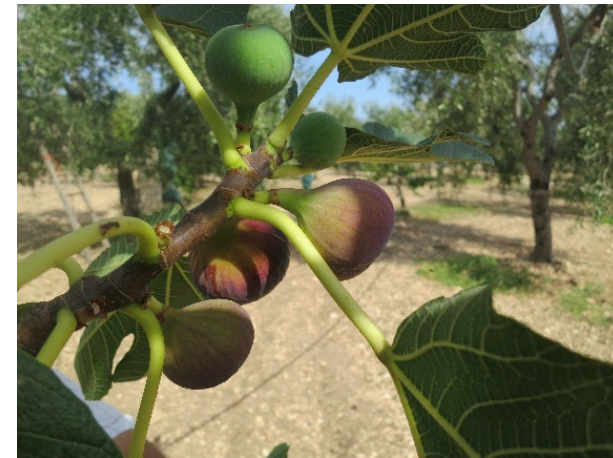
Del Vescovo (Mattinata)