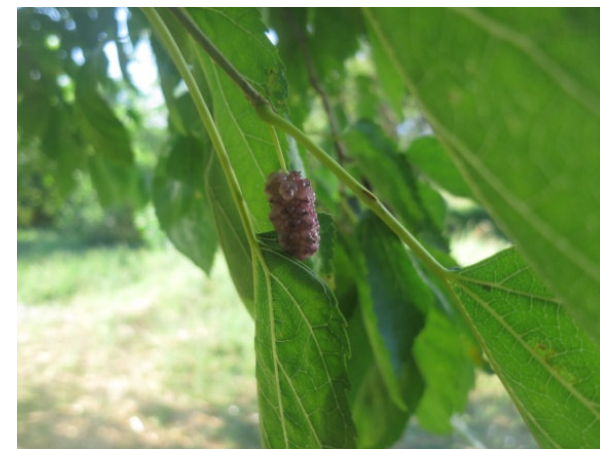
Molinaro (Ceglie Messapica)