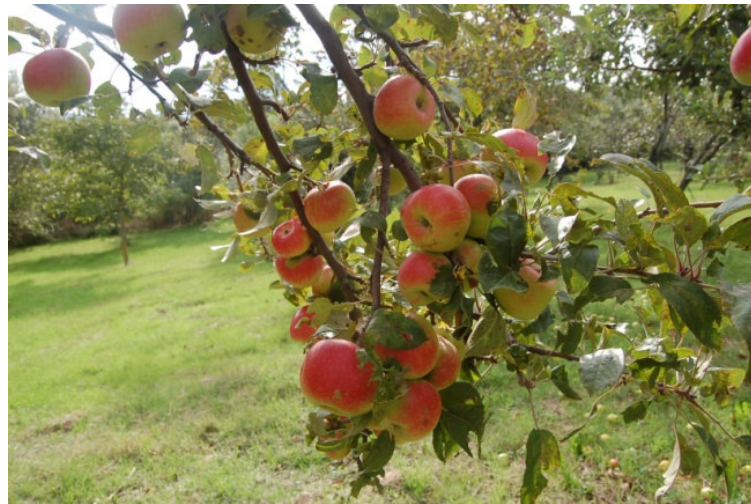
Chianella (San Marco La Catola)