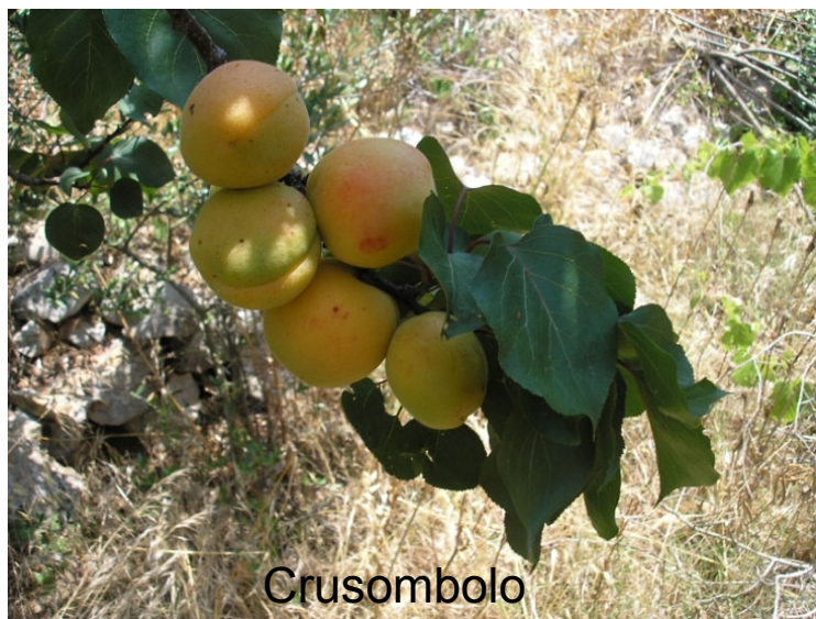
Crusombolo (San Donaci)